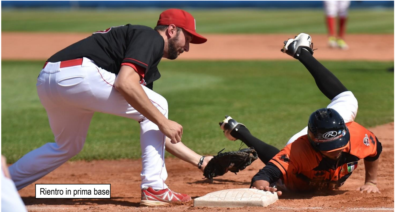
Rientro in prima base