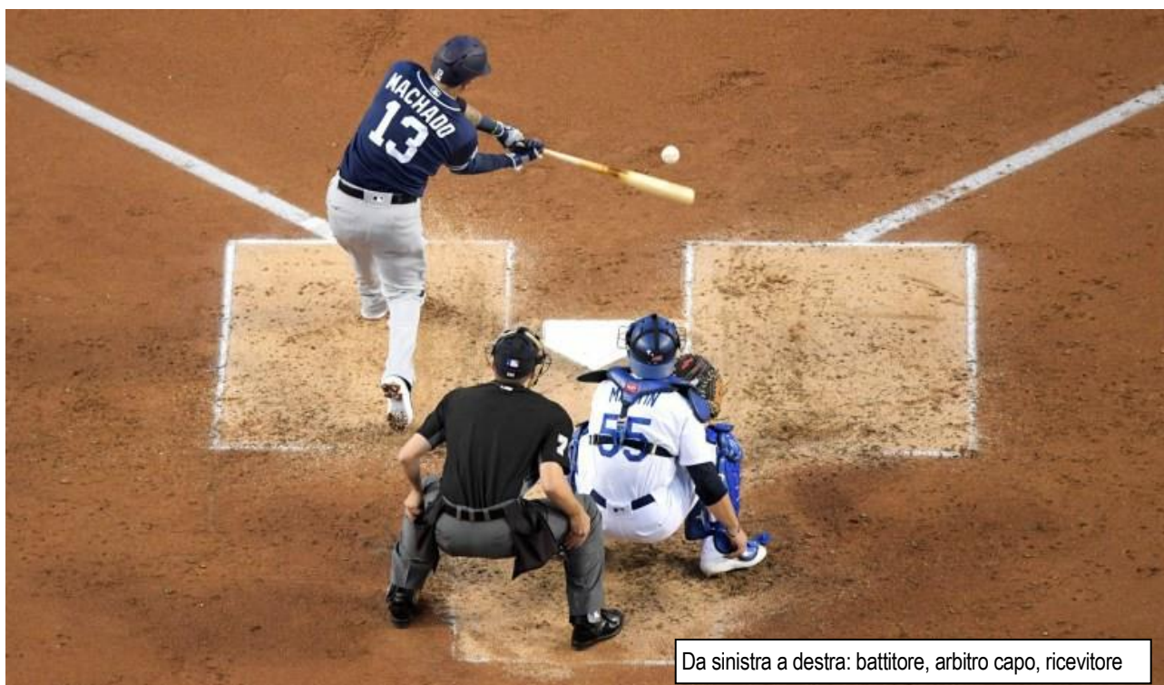
Da sinistra a destra: battitore, arbitro capo, ricevitore