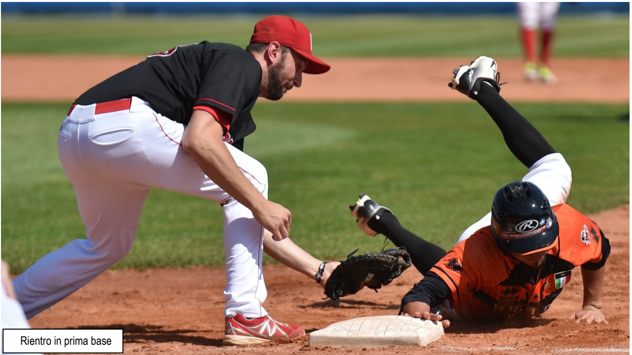
Rientro in prima base