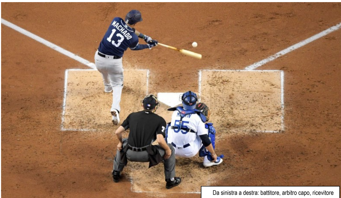
Da sinistra a destra: battitore, arbitro capo, ricevitore