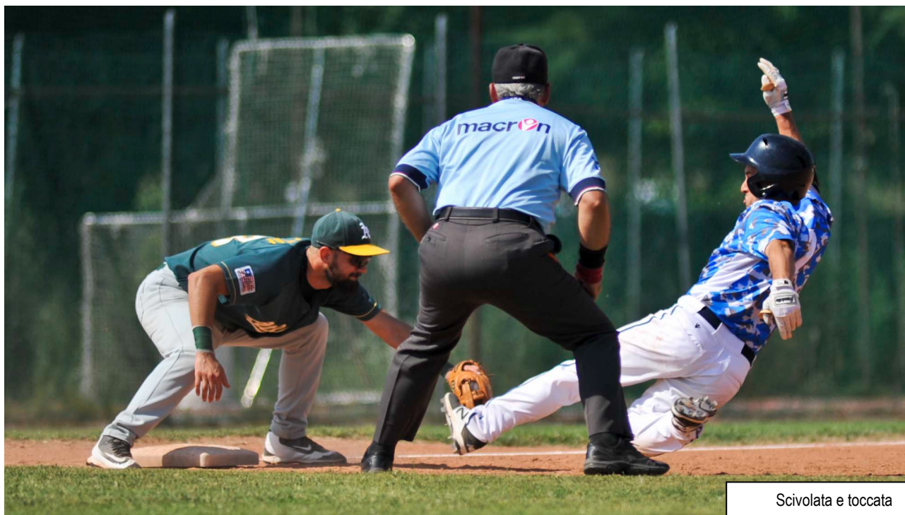
Scivolata e toccata